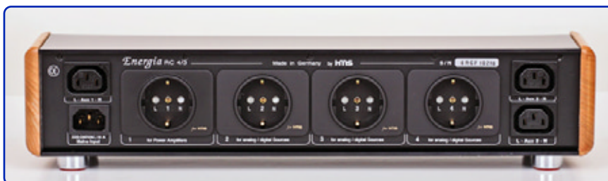
Das Spitzenmodell der neuen RC-Leisten ist die 4/3. Sie verfügt über vier getrennt gefilterte Schukoausgänge und zwei weitere ebenfalls gefilterte IEC-Ausgänge. Wer damit nicht auskommt, kann an Aux 1 eine weitere Verteilerleiste anschließen.

Wird die Einschalttaste gedrückt, schalten drei Relais zeitlich versetzt die Ausgänge frei. Das letzte Relais in der Kette ist mit Goldkontakten versehen, um den Widerstand auf niedrigstes Niveau zu senken. Vorteil dieser Konstruktion ist natürlich, dass selbst Endstufen, die im Moment des Einschaltens Spitzenströme aus dem Netz ziehen, keine Sicherung mehr zum Fallen brin-