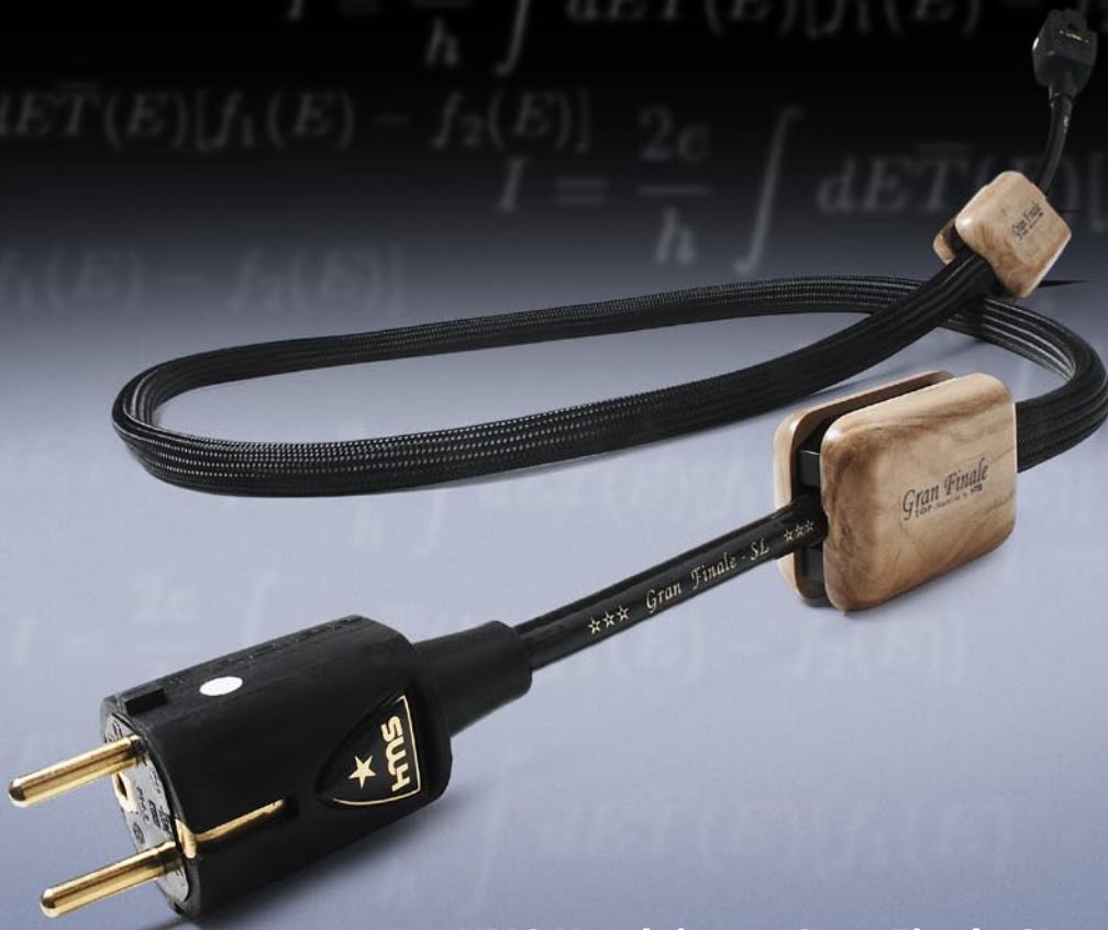
HMS Netzleitung Gran Finale SL