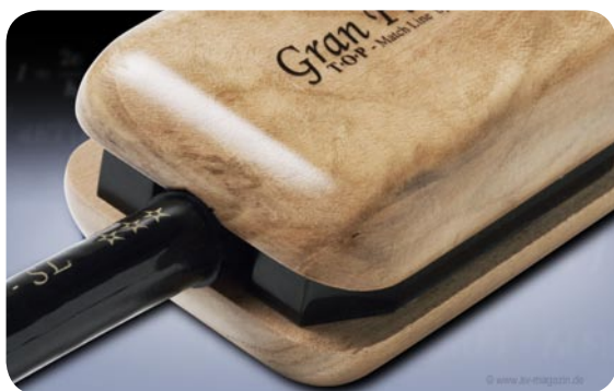
Bei der Verarbeitungsqualität setzt HMS Maßstäbe: Das Kupplungsstück für die Zwillingingleitung ist aus edlem Kirschholz

Unser Testmuster ist 1,5 Meter lang. Technisch und klanglich ist es klug, Stromkabel immer in genau passender Länge zu erwerben. Hervorragende Verarbeitungsqualität in dieser Preisklasse ist ein Muss und der optischen Überprüfung hält die Leitung denn auch mit Bravour stand. Im Vergleich zu anderen Kabeln ist das HMS biegefreudiger. Manche Leitungen sind so starr, dass sie nicht vollständig in den Buchsen sitzen bleiben. Fehlender Kontakt bedeutet aber automatisch Klangeinbußen. Beim Gran Finale SL ist das absolut kein Problem. Sowohl Netzstecker als auch Kaltgerätekupplung sind vergoldet.