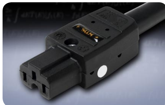
Damit die Komponenten für höchste Wiedergabequalität gerüstet sind, müssen sie an Phase liegend betrieben werden. Hier hilft die Kennzeichnung des Gran Finale SL

Nehmen wir vorweg, dass es bei keinem Versuch Zuordnungsfehler gab. Zu deutlich war die zugunsten des Gran Finale SL produzierte musikalische Differenz: Gefühlvolles Saxofonspiel gewann an Ausdrucksstärke. Was mit der Standardleitung als plattes Klappengeräusch zumindest wahrnehmbar war, hört sich bei Verwendung des HMS sehr viel eher nach Original an. Gesang bekommt mehr Volumen. So hört sich Rebecca Pidgeon einmal nach schönem, aber dünnem Stimmchen an und in anderem Fall extrem ausdrucksstark, ja, bei